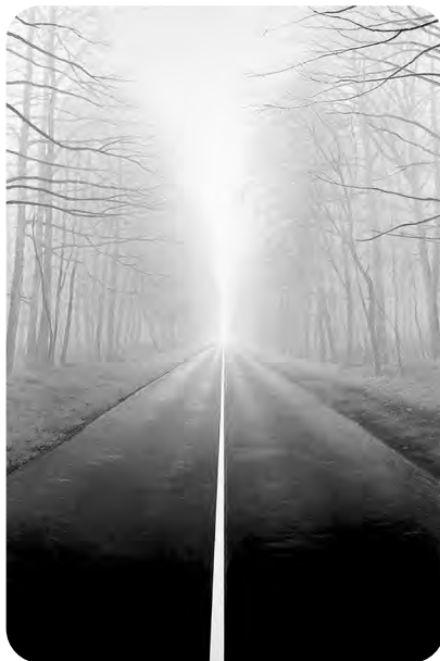
Эрик Булатов. Дорога. Холст, масло. 1989.

С первого взгляда на картину Э. Булатова «Дорога» понятны отличия классической живописи от произведений современного искусства. Зритель в недоумении и оцепенении. Ему кажется, что перед ним не картина, а фотография или кадр из кинофильма. Невероятная реалистичность изображения, краски, приближенные к натуральным, освещение и сюжет произведения – все это напоминает знакомый пейзаж, погружает в восприятие туманного осеннего утра.